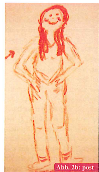
Abb. 2b: post

Körperbilder, die im Rahmen der Bewegungstherapie bei Annette Escher entstanden sind. Oft lasse ich Patient_innen ein Körperbild/Selbstbild malen. Ich bitte sie, sich auf einem Blatt mittlerer Größe mit Ölkreide so zu zeichnen, wie sie sich im Moment wahrnehmen und erleben. Malen ermöglicht als kreativer, semiprojektiver Prozess, sich nonverbal auszu-