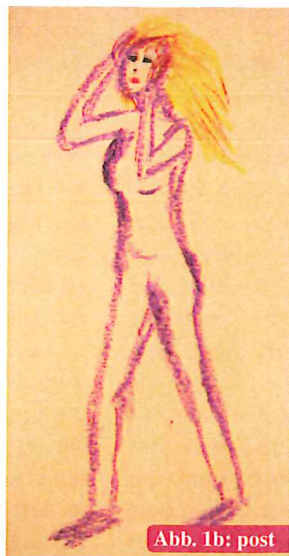
Abb. 1b: post