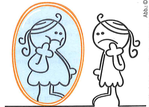
Körperbilder und -erfahrungen sind eng mit Selbstwertgefühlen verflochten.